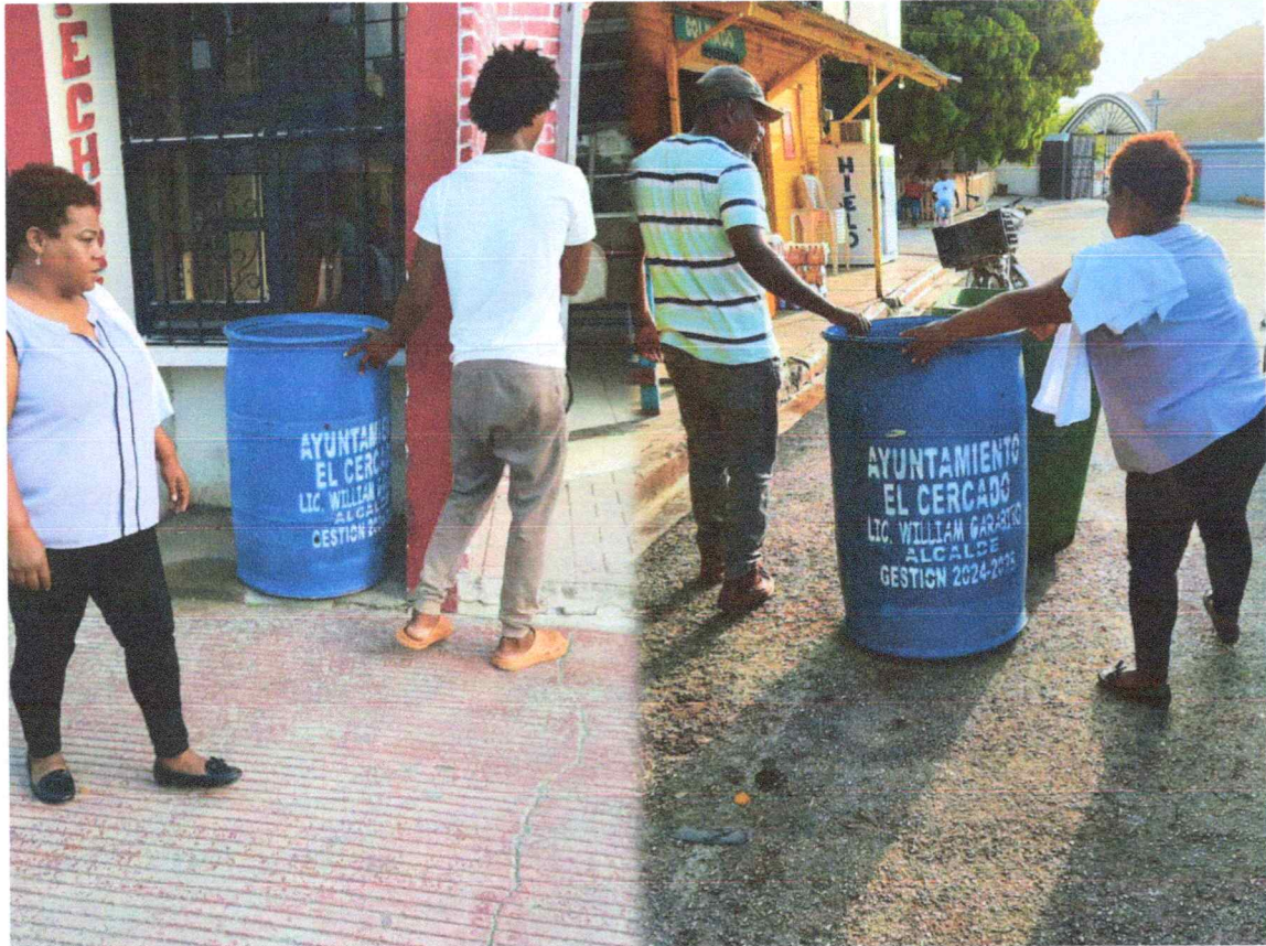
Ubicado En La Calle Mella Necesidad De Zafacón: 2