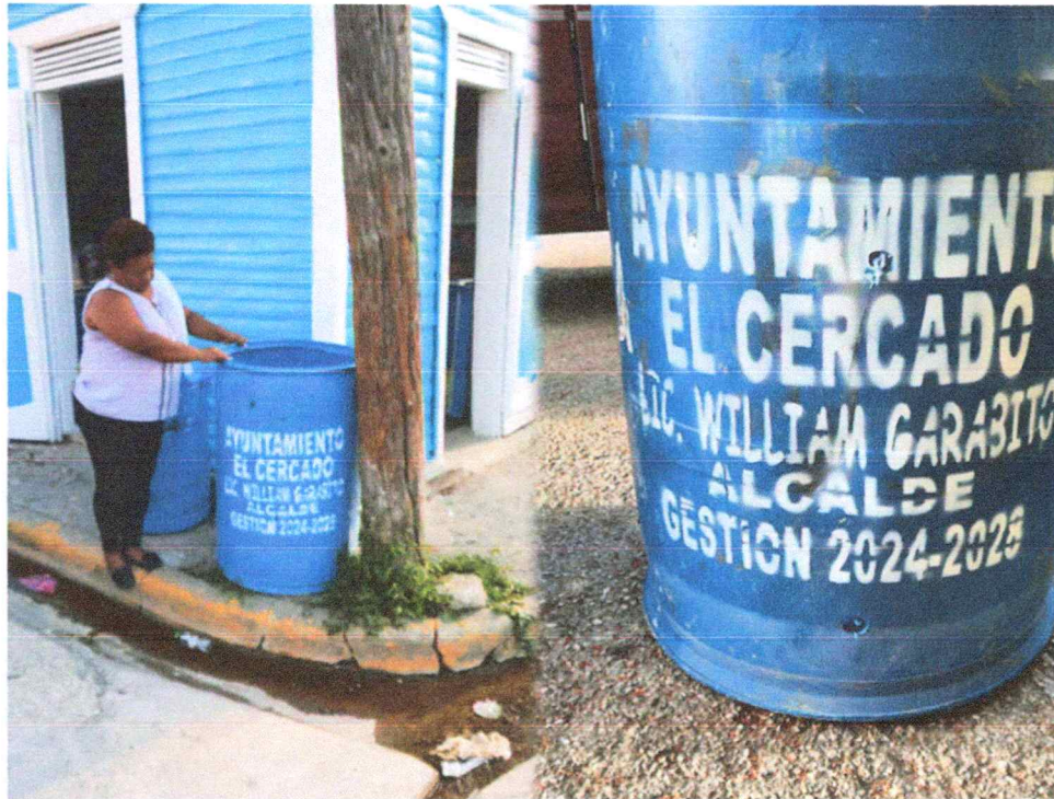
Ubicado En La Calle Sánchez Necesidad De Zafacones: 2